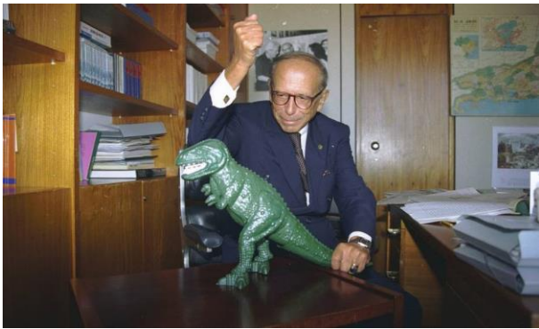
Roberto Campos em seu gabinete no Congresso Nacional, em 1995

— Após diplomar-se em Teologia e Filosofia, iniciou sua vida pública no Itamaraty. No segundo Governo Vargas, contribuiu para a criação do BNDES. Também atuou no governo Juscelino Kubitschek, na elaboração do Plano de Metas. No Governo Castello Branco, foi Ministro do Planejamento — lembrou Campos Neto.