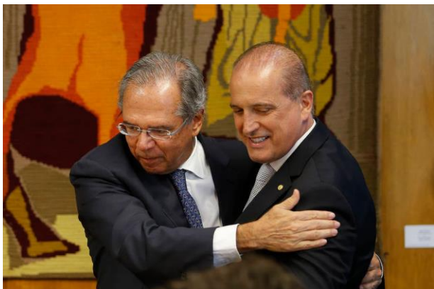
Paulo Guedes e Onyx Lorenzoni. Foto: Dida Sampaio/Estadão - 19/02/2019

Nesta quinta-feira, o ministro da Economia também elogiou o senador Ciro Nogueira (PP-PI), que deverá assumir a Casa Civil na reforma ministerial que está sendo promovida pelo presidente Jair Bolsonaro. "Ciro Nogueira é um profissional de política. Ele tem sido um grande apoiador das nossas reformas", afirmou Guedes na entrada do ministério, após participar de evento de inauguração da Antena Multissatelital no Ministério da Defesa.