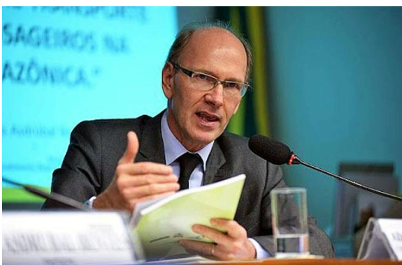
Diretor da Agência participou do Brasil Export – Norte Export em Belém

ANTAQ - Agência Nacional de Transportes Aquaviários