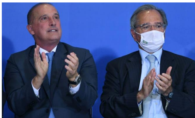
Onyx Lorenzoni, que vai para o Ministério do Trabalho, e o ministro da Economia, Paulo Guedes

BRASÍLIA — O ministro da Economia, Paulo Guedes, disse nesta quinta-feira que a recriação do Ministério do Trabalho para abrigar Onyx Lorenzoni não ameaça o "coração" da política econômica. Lorenzoni está de saída da Secretaria de Governo e será acomodado numa pasta fruto do desmembramento do Ministério da Economia.