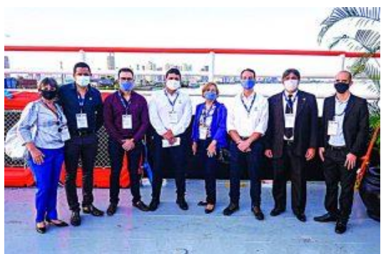
Diretoria da CDP

Desde 2019 a CDP busca a melhoria de gestão e alavancagem econômica, de forma a permitir a realização de reforma estruturante com a utilização de recursos próprios, em 2019 a Companhia foi agraciada com 3 prêmios concedidos pela Brasil Export (1º Lugar: Variação da Margem Ebitda; 2º Lugar: Crescimento de Movimentação do Porto de Santarém; 3º Lugar: Crescimento de Movimentação do Porto de Vila do Conde).